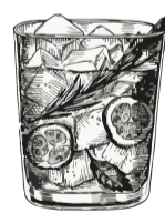
Gin & Tonic