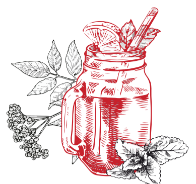
Elderflower & Mint 4.90