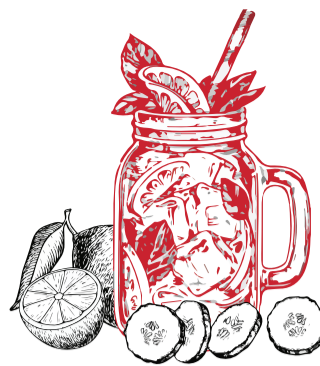
Cucumber & Lemon 4.90