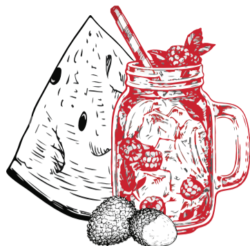
Lychee & Melon 4.90